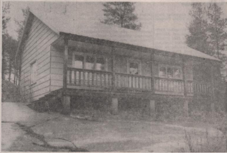
Sedan några år tillbaka står SGU-stugan vid Rödviken öde. Synd tycker många Nordmalings-ungdomar.