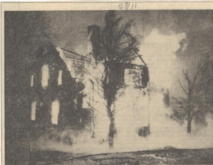
Elden tog allt. Inte ens en tesked kunde räddas.